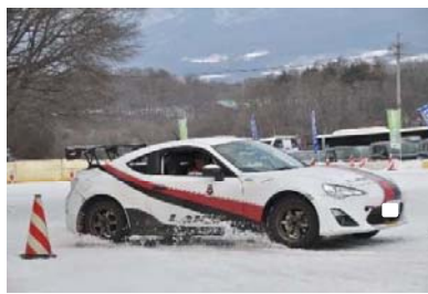
【インストラクターによるデモ走行】