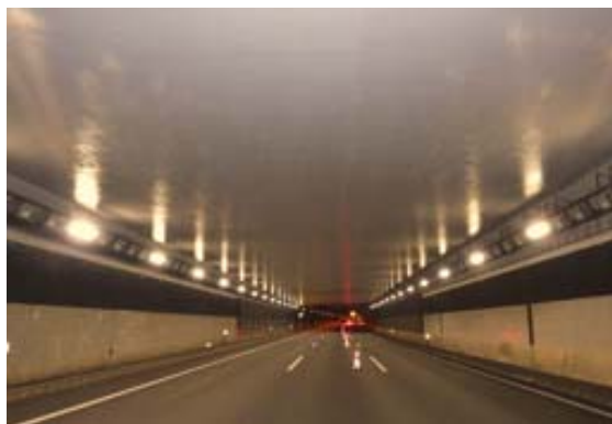
はく落対策工事(完成写真)