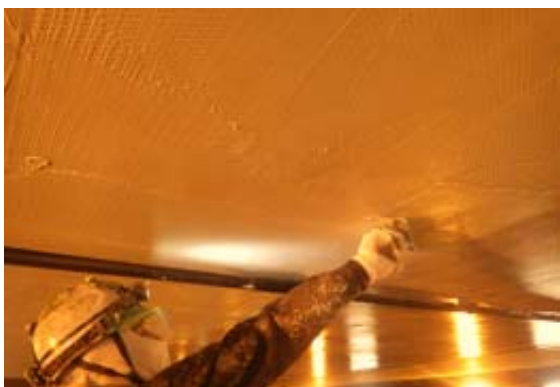
はく落対策工事(作業写真)