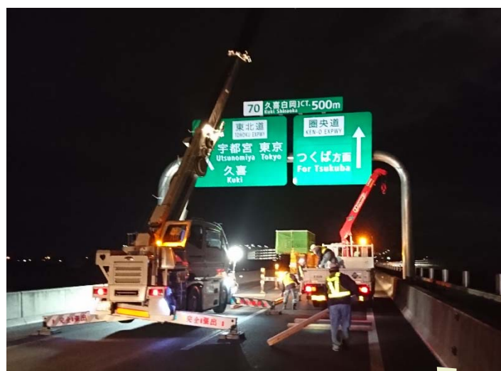
標識設置工事イメージ

外環道 三郷南ICから高谷JCTへの延伸及び三郷中央IC新設に伴い、標識の設置工事を実施します。