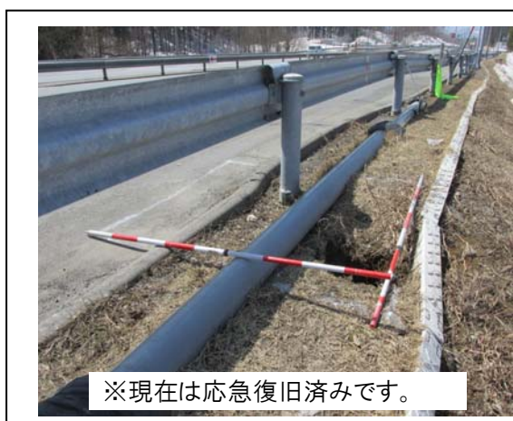
【本線盛土の変状状況】