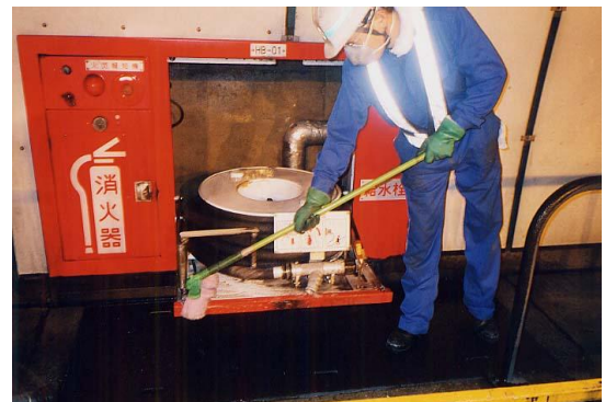
非常用設備清掃・点検

これらの工事を実施するにあたり、お客さまへの影響を極力少なくするため、交通量が少ない平日の夜間に通行止めを行い、工事を集中的かつ効率的に行います。お客さまに安全・快適に高速道路をご利用いただくため、ご理解とご協力をお願いします。