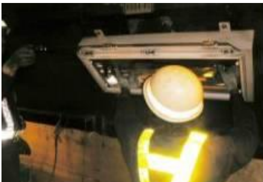
トンネル照明設備清掃・点検