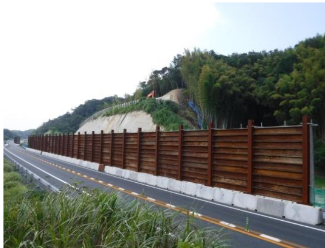
落石防護柵の撤去前

館山自動車道(君津～富津竹岡)の4車線化工事に伴い供用路線への安全対策のために設置した落石防護柵及び仮設ガードレール・目隠しネットは、工事進捗に併せ一部撤去を行います。