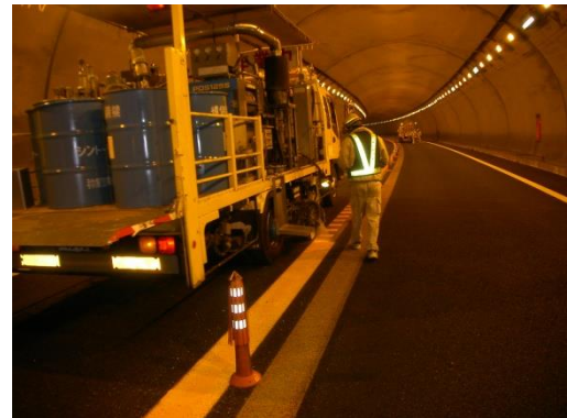
路面標示工の設置