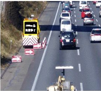
①「渋滞終了」をお知らせする表示